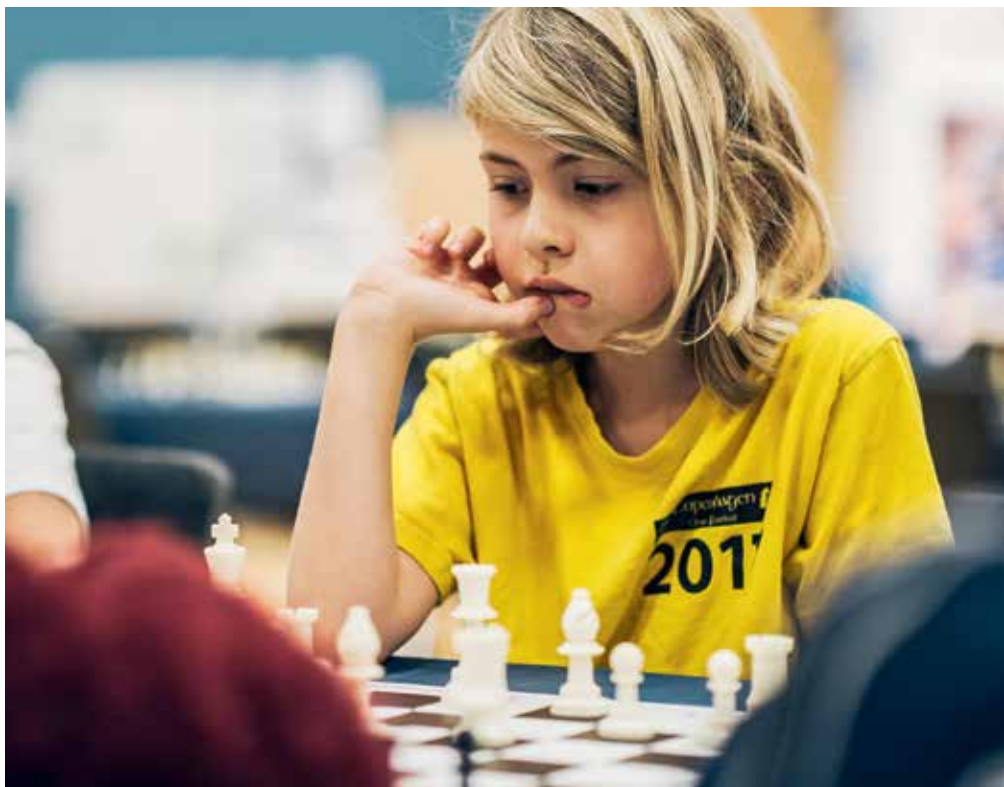
Så skal der tænkes strategisk og fremadrettet: Sf3 til g5 og skak!

I nogle kommuner finder de lokale skoler sammen om kommunestævner, hvor der dystes om titlen som kommunemester